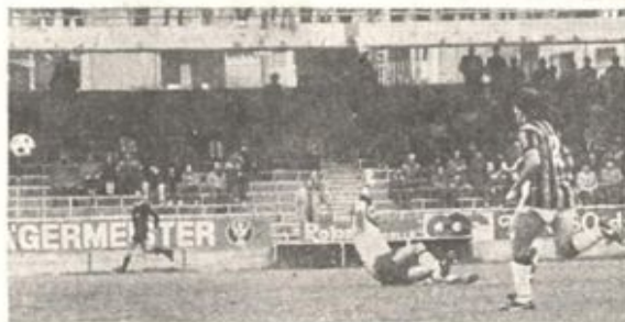
La rete del Taranto: Fracas (coperto) batte Laveneziana

NOTE: giornata coperta, terreno in buone condizioni, spettatori 8.500 circa (5598 paganti e 1571 abbonati) per un incasso al botteghino di L. 11.598.000 (più una quota abbonamenti di L. 8.240.000). Ammoniti Bertazzon, Valente e Petruzzelli. Angoli 4 a 1 per