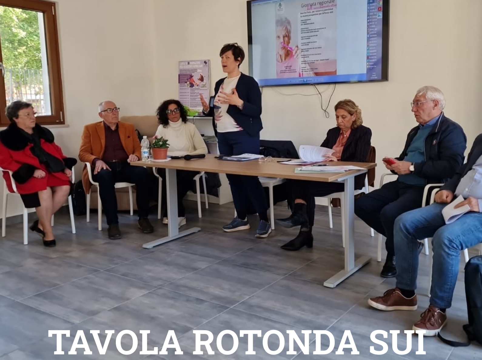
TAVOLA ROTONDA SUI TEMI DELLA TERZA ETÀ