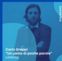
Carlo Greppi "Un uomo di poche parole" Laterza