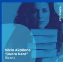
Silvia Avallone "Cuore Nero" Rizzoli