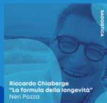
Riccardo Chiaberge "La formula della longevità" Neri Pozza