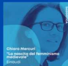
Chiara Mercuri "La nascita del femminismo medievale" Einaudi