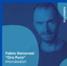
Fabio Genovesi "Oro Puro" Mondadori