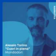
Alessio Torino "Cuori in piena" Mondadori