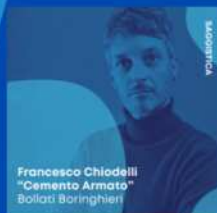
Francesco Chiodelli "Cemento Armato" Bollati Boringhieri