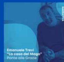
Emanuele Trevi "La casa del Mago" Ponte alle Grazie