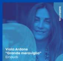
Viola Ardone "Grande meraviglia" Einaudi