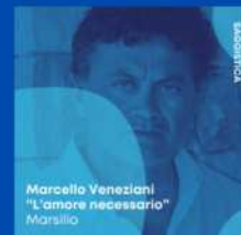
Marcello Veneziani "L'amore necessario" Marsilio