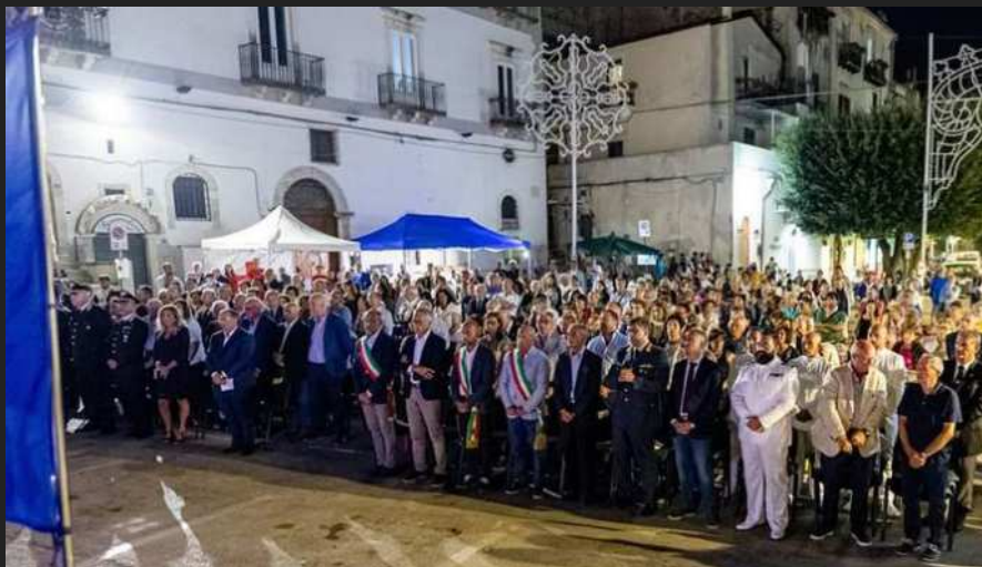
Nella foto un momento dell'edizione 2023 del Premio