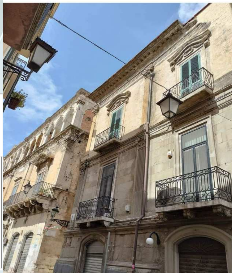
Buongiorno da Foggia Via Arpi... Altro...