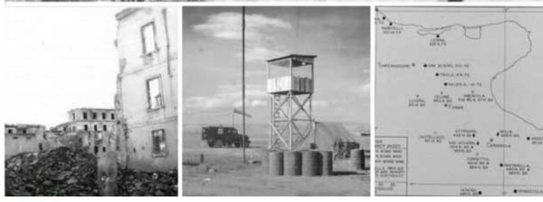
Buongiorno da Foggia Via Arpi... Altro...