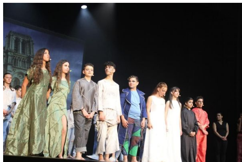
Nella foto qui sopra i giovani protagonisti dell'applaudito spettacolo andato in scena al Teatro del Fuoco di Foggia