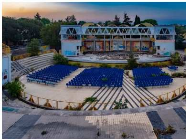
Sopra l'anfiteatro Mediterraneo e sotto uno degli ipogei del centro storico di Foggia.