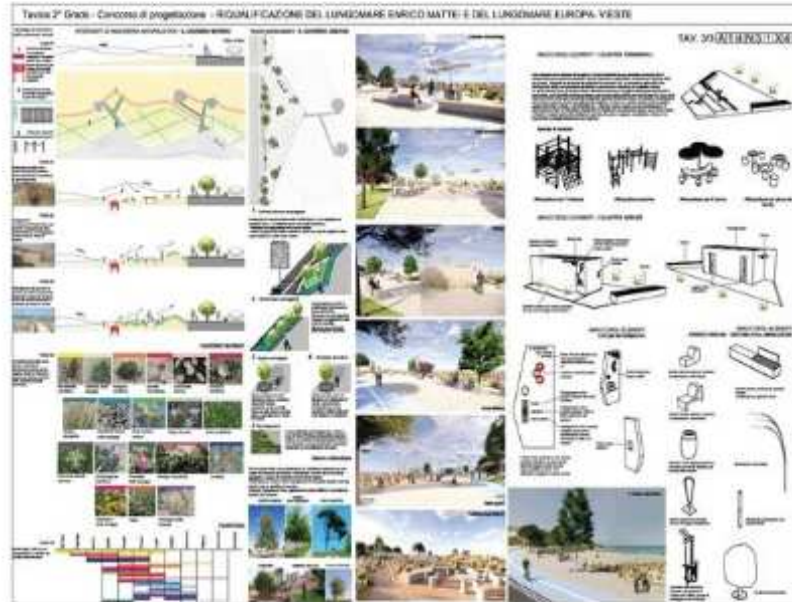
Il progetto dell'architetto Marco Di Gennaro

Un progetto che quindi sposa appieno la nostra visione futura di città. In particolare il progetto ci restituisce una idea dei lungomari in cui lo spazioturistico balneare viene valorizzato, accrescendone la connotazione turistica, donando nel contempo nuovi spazi pubblici flessibili per un potenziale sviluppo e utilizzo destagionalizzato”.