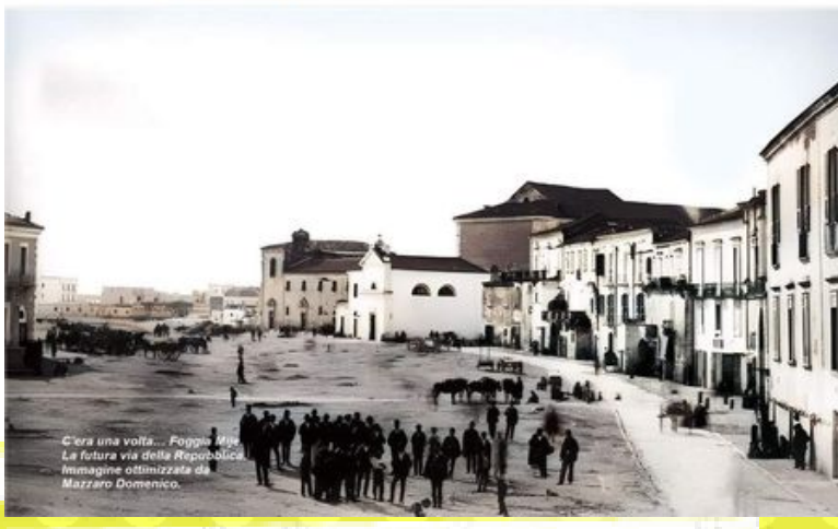
C'era una volta... Foggia #pg La futura via della Repubblica Immagine ottimizzata da Mazzaro Domenico.

Via della Repubblica libera dal traffico cittadino. #cosedaltritempi