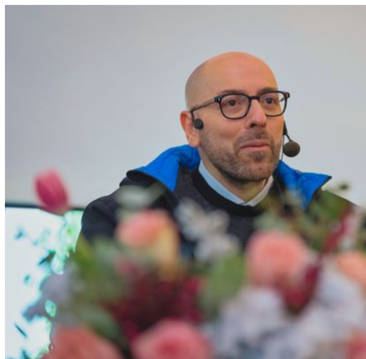
Il Sindaco di Deliceto Pasquale Bizzarro

Noi vogliamo raccontare tutto questo per creare un turismo sostenibile, che attragga l'interesse di chi ama scoprire destinazioni diverse da quelle di massa e faccia innamorare i viaggiatori attenti all'autenticità, all'unicità dei piccoli borghi. È un progetto ambizioso e innovativo in cui crediamo moltissimo, che apre Deliceto al futuro e, allo stesso tempo, costruisce il domani del borgo partendo dalla riscoperta delle proprie radici e della propria storia”. Gli artisti interessati potranno inviare la propria candidatura rispondendo alla manifestazione di interesse entro l'11 marzo 2024.