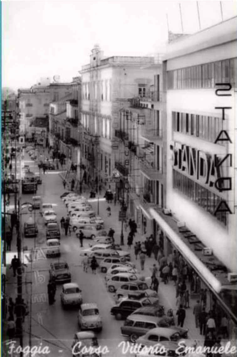
Foggia - Corso Vittorio Emanuele