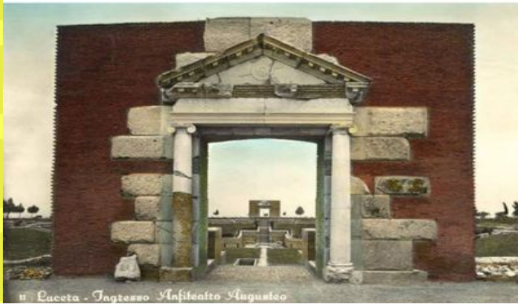
Lucera - Ingresso Anfiteatro Augusto