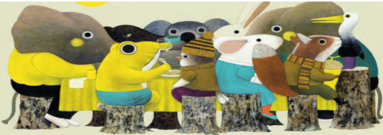
Illustrazione di Simona Ricci